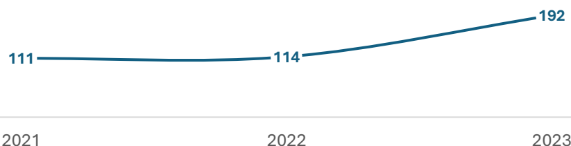
Graficul nr. 1 – Evoluția numărului de chestionarelor predate și validate la FSEII