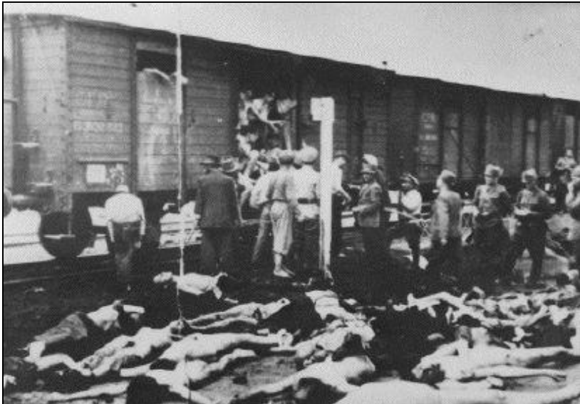
Trenurile morții - Armata Română curăța trenurile de cadavre, pentru ca trenurile să își continue drumul, 30 iunie 1940 (fotografie expusă și în Muzeul Memorialului Holocaustului din Washington)