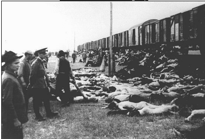
Trenurile morții - curățarea vagoanelor de cadavre ale evreilor. Cadavrele erau descărcate de evrei sub stricta supraveghere a soldaților români, 30 iunie 1941