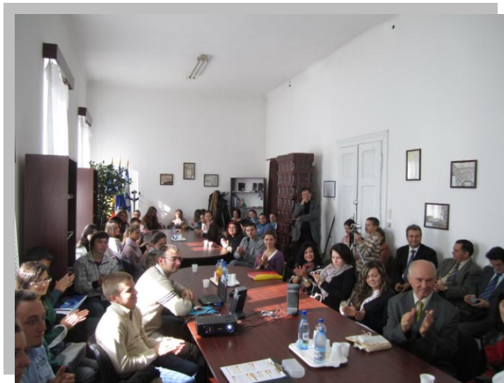
Activitate cu studentii la sediul centrului.

Într-o epocă în care integrarea europeană a devenit realitate, un astfel de centru nu poate face altceva decât să devină un liant al înțelegerii și cunoașterii reciproce.